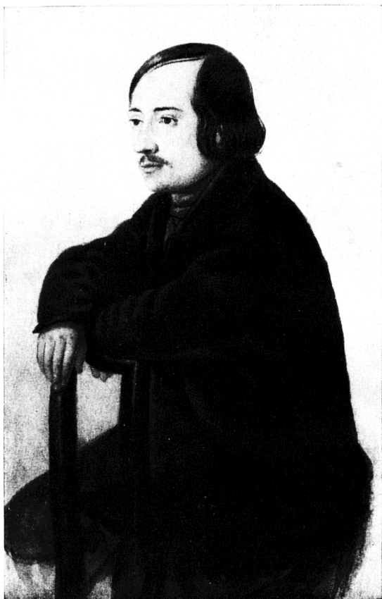
П. А. НЕКРАСОВ Аquareль И. Д. Захарова 1843 г.